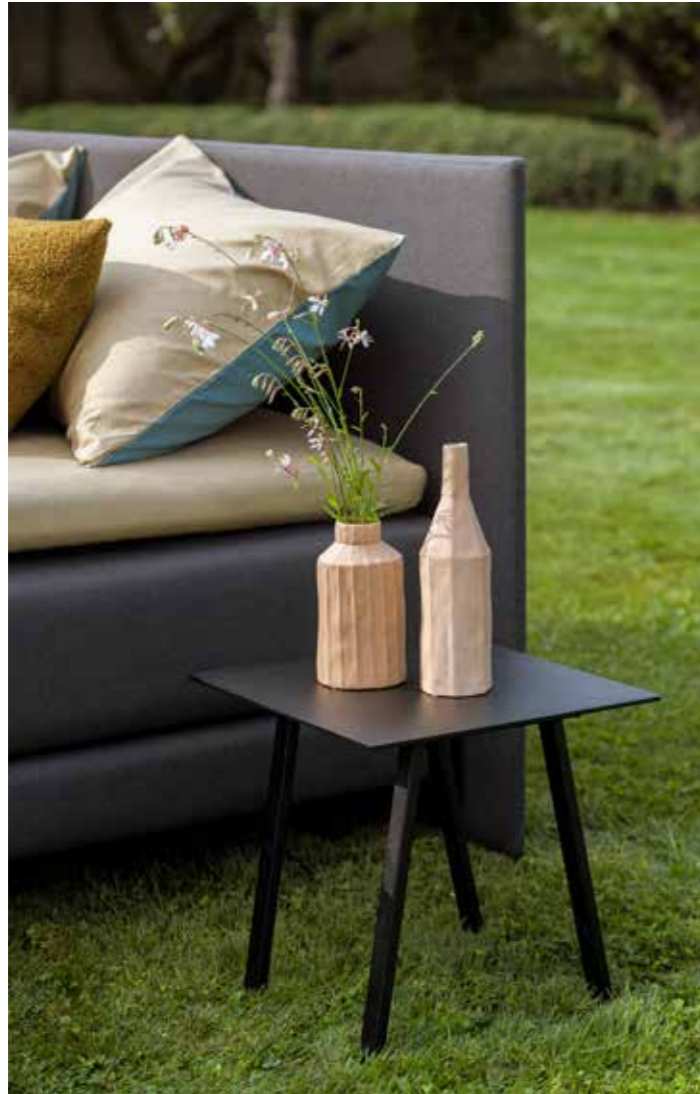
Verkwikkend strak hoofdbord

Quadra schittert in ongedwongen zuiderse kleuren, niet alleen in hartje zomer maar het hele jaar door. Ons dunste hoofdbord Quadra is amper drie cm dik. Samen met de ultradunne boxspring Finesse ontstaat een uiterst hedendaagse, minimale look en feel. Voor dit bed haalden we inspiratie in Scandinavië. Omdat we prat gaan op een onberispelijke touch kozen we onze heerlijk ontspannende Mölna matrassen. Afwerken doen we met cuddly kussens in de teddystof Doodle, speciaal voor dat extra tedere en zachte accent.