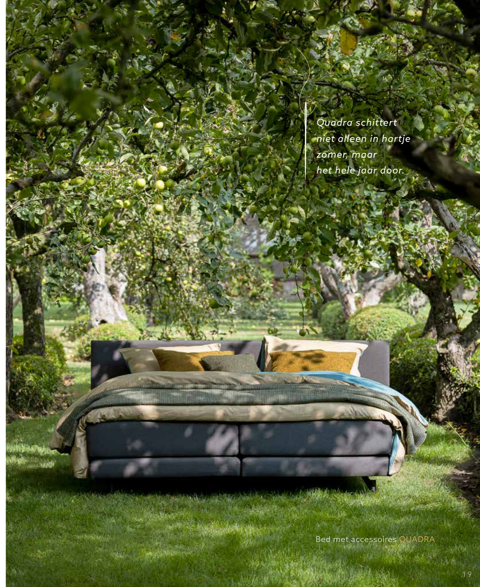
Bed met accessoires QUADRA

Quadra schittert niet alleen in hartje zomer, maar het hele jaar door.