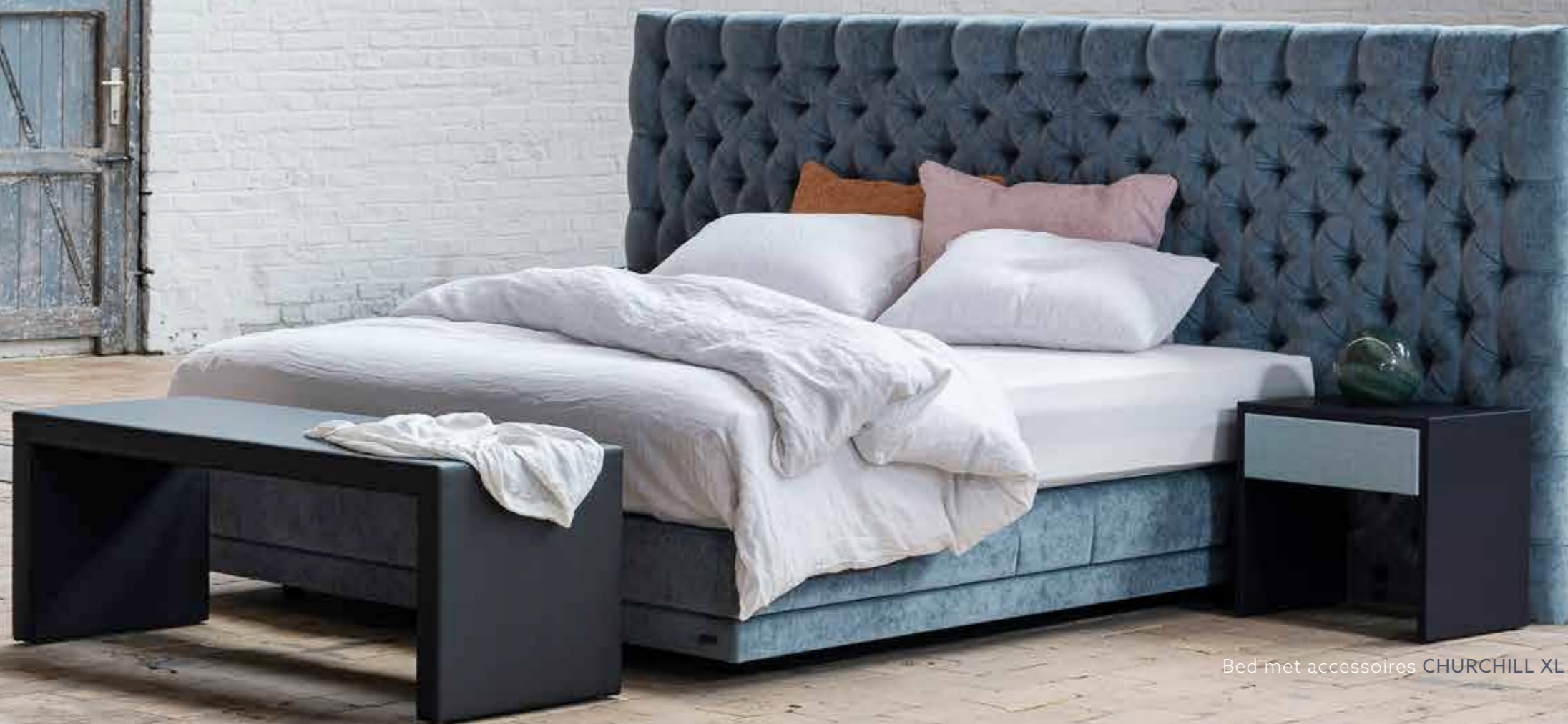
Bed met accessoires CHURCHILL XL

Churchill XL met een royaal hoofdbord van maar liefst drie meter breed.