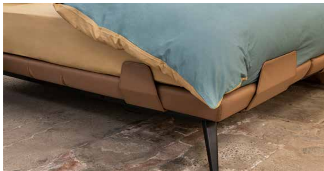
Le sens du détail

Le sommier tapissier Elegance à réglage électrique suit la même forme biseautée que la tête de lit. Le confort est garanti grâce à la télécommande, qui se range dans un compartiment de rangement pratique. Ceux qui aiment lire au lit seront ravis par l'élégance et la finesse des lampes LED. Galante allie le design subtil au confort sans limites.