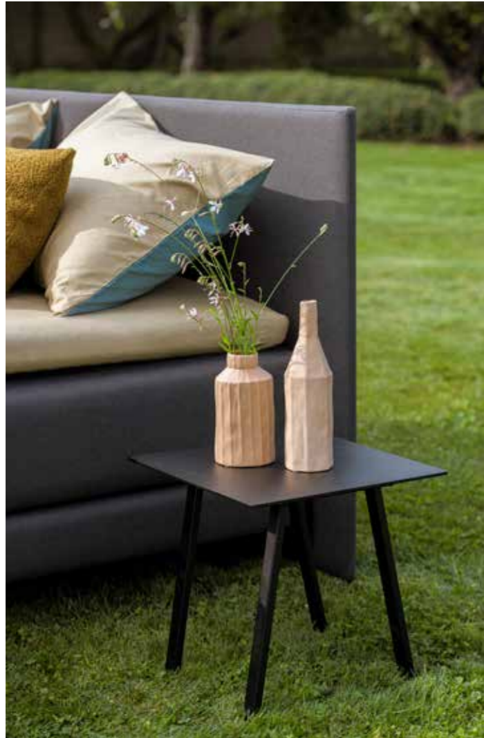
Tête de lit à la fois revigorante et épurée

Quadra brille par ses couleurs méridionales décontractées, non seulement en plein été, mais durant toute l'année. Notre tête de lit la plus fine, Quadra , mesure à peine trois centimètres d'épaisseur. Associé au sommier tapissier Finesse ultra fin, elle crée une apparence et une sensation particulièrement contemporaines et minimalistes. Pour ce lit, nous nous sommes inspirés de la Scandinavie. Guidés par notre fierté d'un touch impeccable, nous avons choisi nos matelas Mölna étant merveilleusement relaxants. L'ensemble est complété par des coussins cuddly en tissu teddy Doodle, spécialement conçus pour ce toucher tendre et doux.