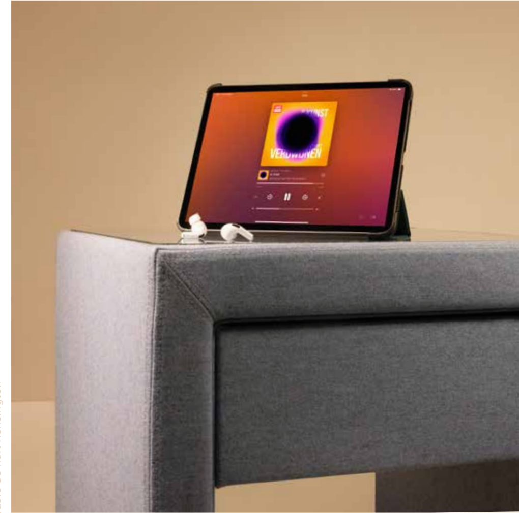
Table de nuit Kensington

À la recherche de Jeanne - la recherche d'une grand-mère dont on ne parle jamais Les Baladeurs - des histoires d'aventuriers Dalida et moi - une rencontre inattendue entre un jeune philosophe et la chanteuse disparue tragiquement en 1987 Les Aventures de Tintin - une nouvelle interprétation des 5 bandes dessinées les plus célèbres de Hergé Transfert - révélation du monde moderne et de ceux qui y vivent