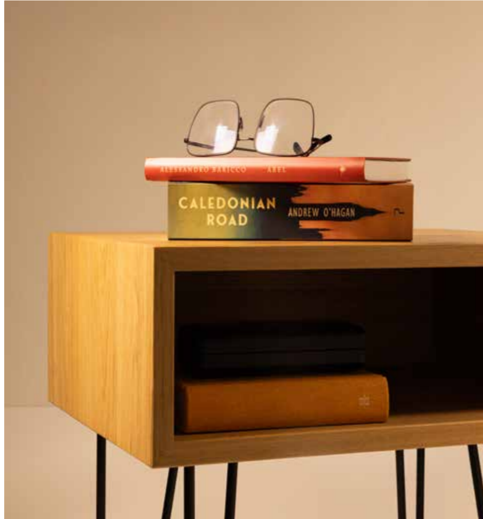
Table de nuit Tube

Le Chant d'Achille - Madeline Miller Abel - Alessandro Baricco Caledonian Road - Andrew O'Hagan L'île aux arbres disparus - Elif Shafak Un animal sauvage - Joël Dicker Plus grand que le ciel - Virginie Grimaldi